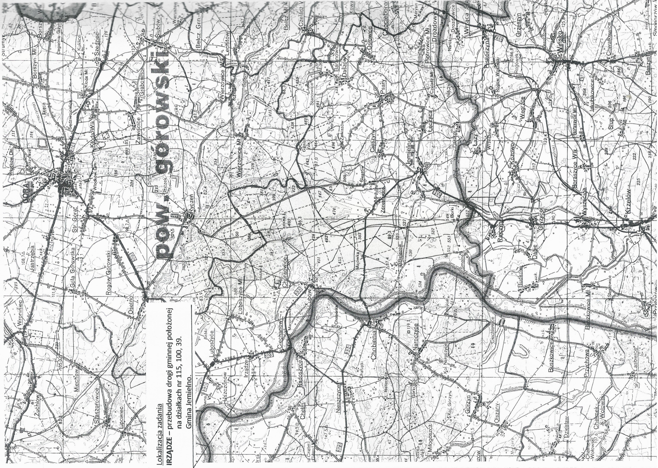
Lokalizacja zadania IRZĄDZE – przebudowa drogi gminnej położonej na działkach nr 115, 100, 39. Gmina Jemielno.