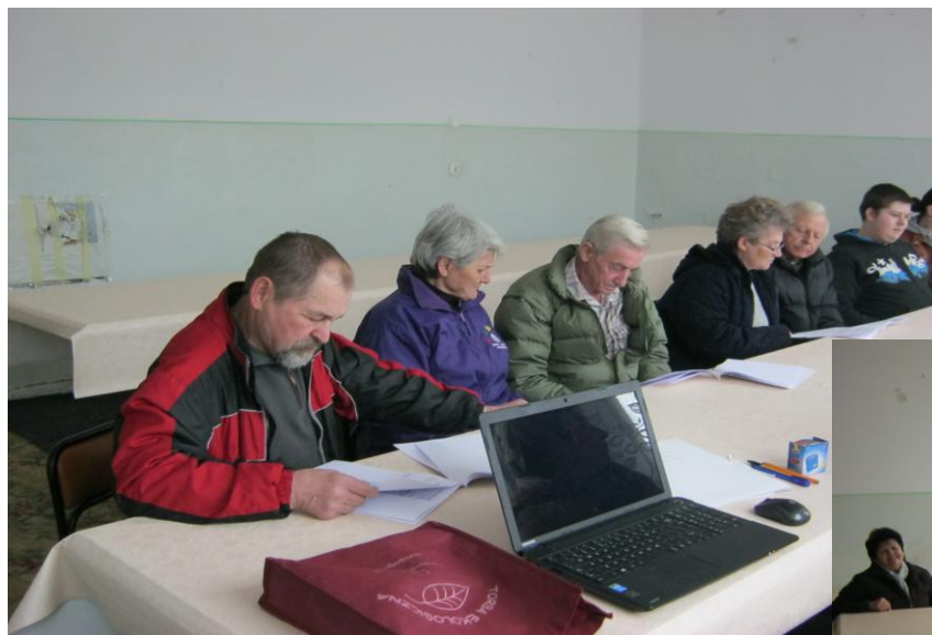
Foto z warsztatów

Wieś Bieliszów to miejsce, w którym coś się dzieje a mieszkańcy mają dogodne warunki do aktywnego spędzania czasu. Korzystając z rozwiniętej oferty rekreacyjnej, lokalnych zasobów, infrastruktury technicznej i społecznej rozwija się agroturystyka. Grupa odnowy wsi współpracuje z organami władzy i sołectwami na terenie gminy. Każdy mieszkaniec czuje się ważnym członkiem społeczności i jest zaangażowany w jej życie. Bieliszów to centrum aktywności gdzie dobrze się żyje.