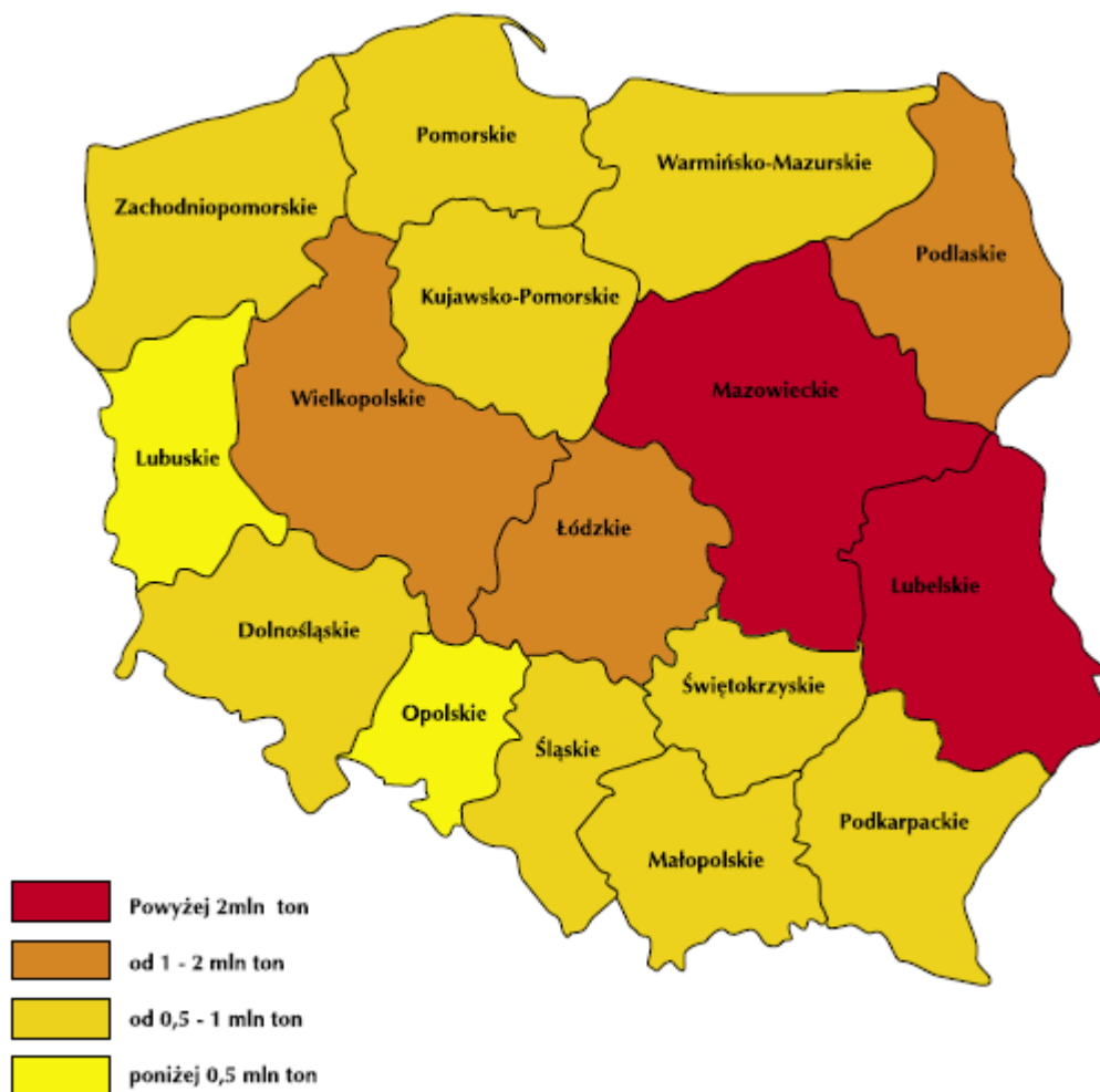
Rysunek 2 Rozmieszczenie wyrobów azbestowych na terenie kraju w układzie wojewódzkim