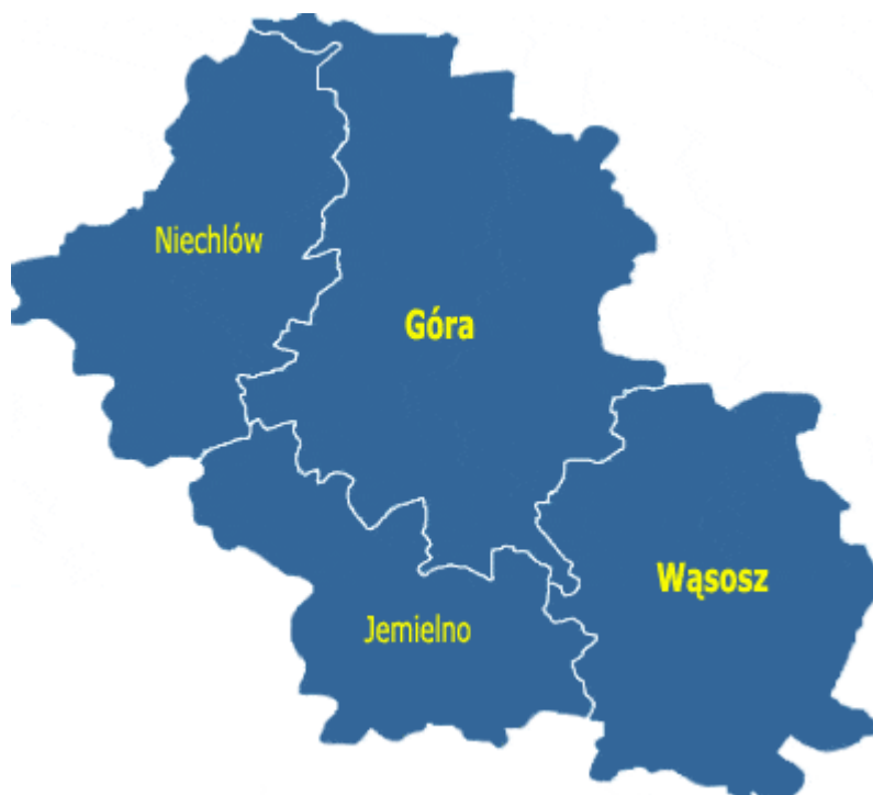
Rysunek 3 Położenie Gminy Jemielno na tle Powiatu Górowskiego