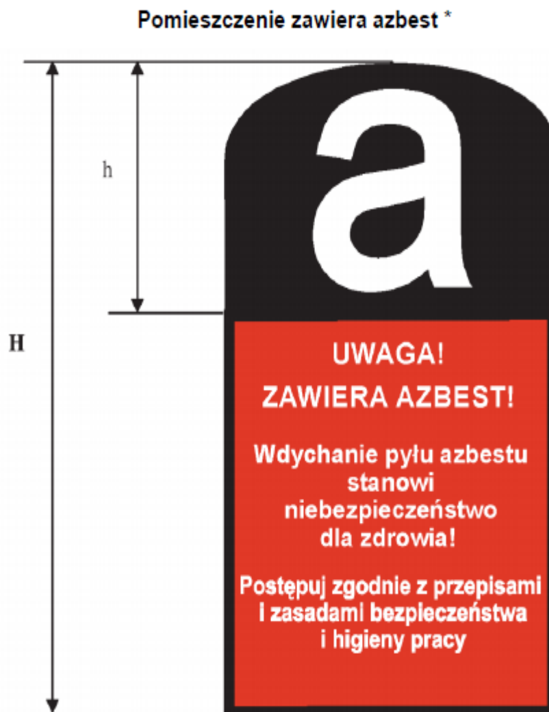
Rysunek 1 Graficzny wzór oznakowania azbestu i wyrobów zawierających azbest